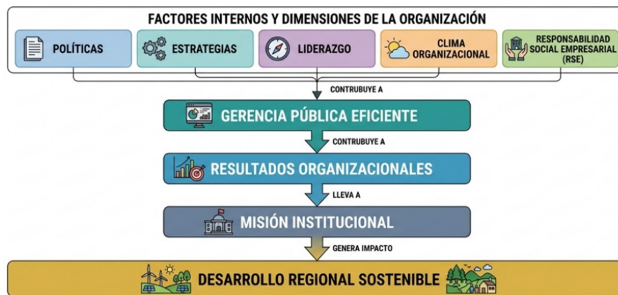
Fig. 3. Modelo integrador de gerencia pública eficiente y misión institucional.

La integración de los hallazgos estadísticos y el análisis por clúster permite concluir que la relación entre gerencia pública eficiente y misión institucional no es únicamente lineal, sino también estructural y evolutiva. La Figura 3 propone un modelo integrador en el que la gerencia pública eficiente actúa como un sistema articulador entre las dimensiones organizacionales y los resultados institucionales. Este modelo evidencia que la mejora en la gestión interna no solo impacta la misión institucional, sino que también contribuye al desarrollo regional sostenible.