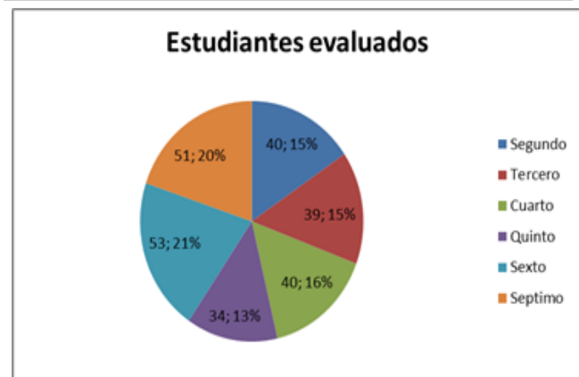
Gráfico 1 Muestra de estudiantes evaluados

Del total de estudiantes, se llevó a cabo la evaluación de 257 estudiantes de cinco (5) escuelas seleccionadas por conveniencia, distribuidos entre el segundo y séptimo año de básica.