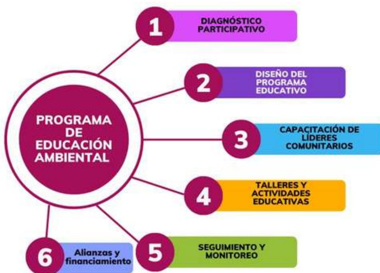
Fig. 1. Fases realizadas para la concepción y elaboración de la propuesta.

El trabajo desarrollado estuvo formado por seis fases de trabajo, las cuales se describen en la Fig. 1. Se observa que estas fases corresponden a los elementos de desarrollo de la propuesta.